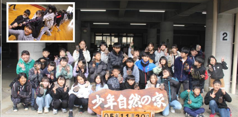
11月29日（水）・30日（木） 5年生宿泊研修！！ 5の4です！ ルールを守り、助け合い、力を合わせるとこんなに楽しいことが分かりました。