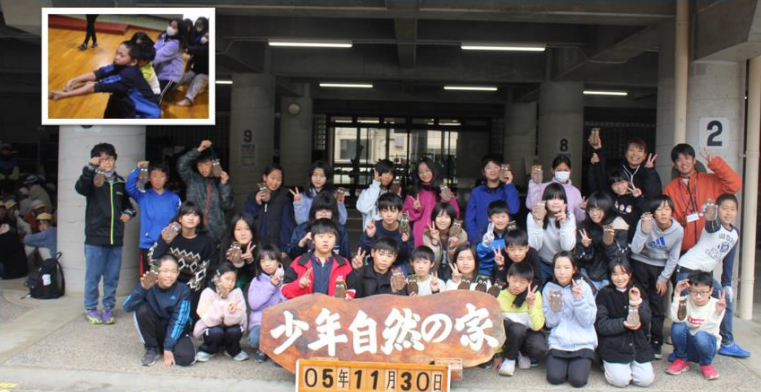
11月29日（水）・30日（木） 5年生宿泊研修！！ 5の1です！ ルールを守り、助け合い、力を合わせるとこんなに楽しいことが分かりました。