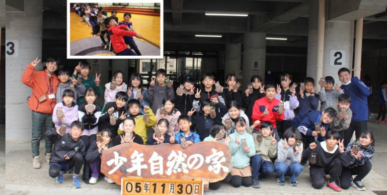
11月29日（水）・30日（木） 5年生宿泊研修！！ 5の2です！ ルールを守り、助け合い、力を合わせるとこんなに楽しいことが分かりました。

令和五年 十一月二十九日三十日 五年生宿泊研修 ここで「出し切った」 君たちの姿から、学年の パワーを感じた。 この次の学校を任せ る存在として、これから 大きく育ててほしい。 まずは、授業で勝負。 学級全員で学び合う姿 をつくりあげてください い。 そして 「六年生を送る会」 計画する力、全校を動 かす力を発揮し、すてき な会にしてください。