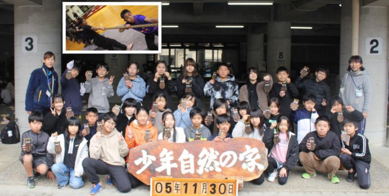
11月29日（水）・30日（木） 5年生宿泊研修！！ 5の3です！ ルールを守り、助け合い、力を合わせるとこんなに楽しいことが分かりました。